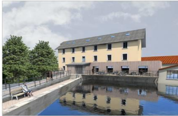
PRIS "Le Vieux MOULIN" JOUY EN JOSAS et réhabilitation pour la construction et aménagement d'un logement municipal