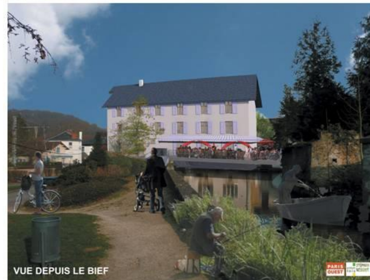
VUE DEPUIS LE BIEF