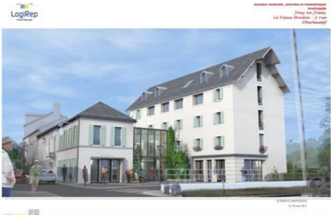
LogiRep PRODIGE CONCEPTION, SERVICES ET RESTAURATION municipale Jouy en Josas Le Vieux Moulin - 2 rue Oberkampf B&O VUE SUR LE PARVIS