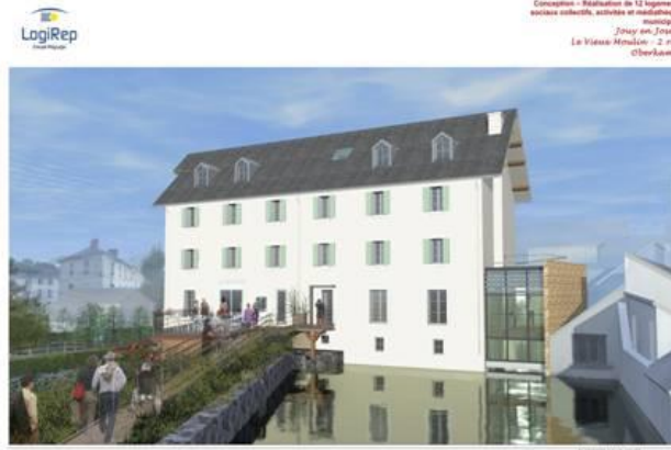
Conception - Réhabilitation de 12 logements sociaux collectifs, actuels et modernes municipaux Zouy en Josas Le Vieux Moulin - 2 rue d'Herkenepf

LogiRep 10 rue de la République 91000 Evry-Courcouronnes Tél : 01 39 39 39 39 www.logirep.com