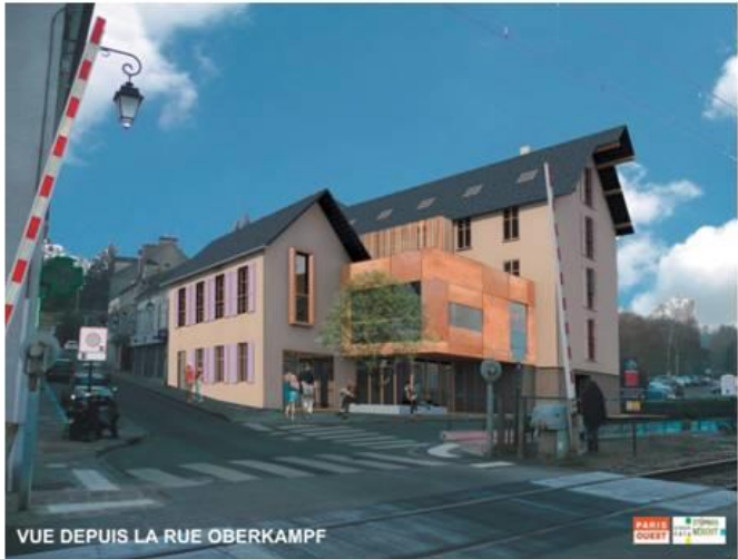
VUE DEPUIS LA RUE OBERKAMPF PARIS OUEST